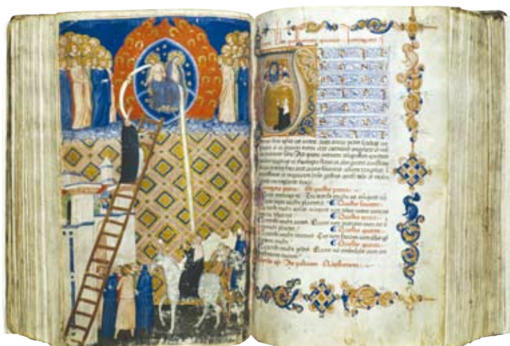
Psautier de la reine Hedwige, Naples, 1375-1377.