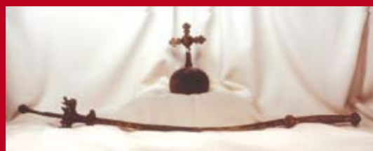
L'orbe et le sceptre de la reine Hedwige, Pologne, XIV e siècle.

À quoi voyez-vous la grande valeur de ces objets ? Qu'est-ce qui montre qu'ils appartenaient à une reine ? Montrer en quoi ces dons ont servi la réputation de la reine telle qu'elle est décrite dans l'épithète et plus tard sa légende.