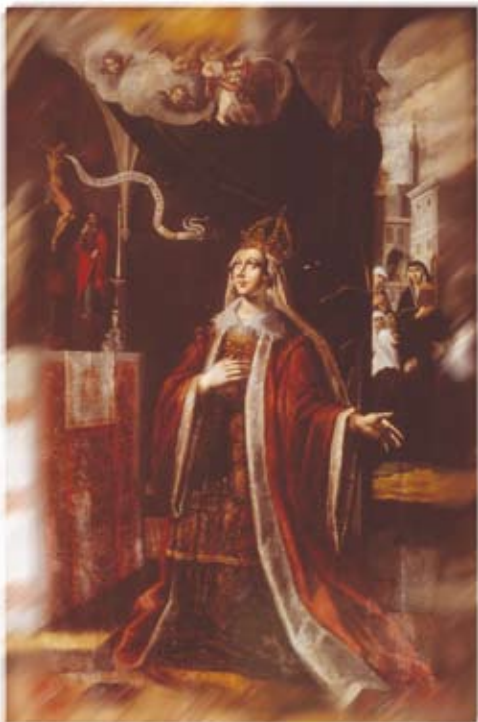
Ste Hedwige, détrempe et huile sur bois, XVII e siècle, Cracovie, Église Ste Croix.

Les premières relations entre l'Anjou et la Pologne se nouent au XIV e siècle à la suite de l'accession de princes angevins au trône de Hongrie. En 1384, Jadwiga (Hedwige) - princesse d'origine angevine - devient reine d'une Pologne alors forte et influente. Épouse de Ladislas Jagellon, grand-duc de Lituanie, elle symbolise jusqu'à sa mort en 1399 la puissance territoriale, intellectuelle et artistique de son pays qui domine l'Europe centrale.