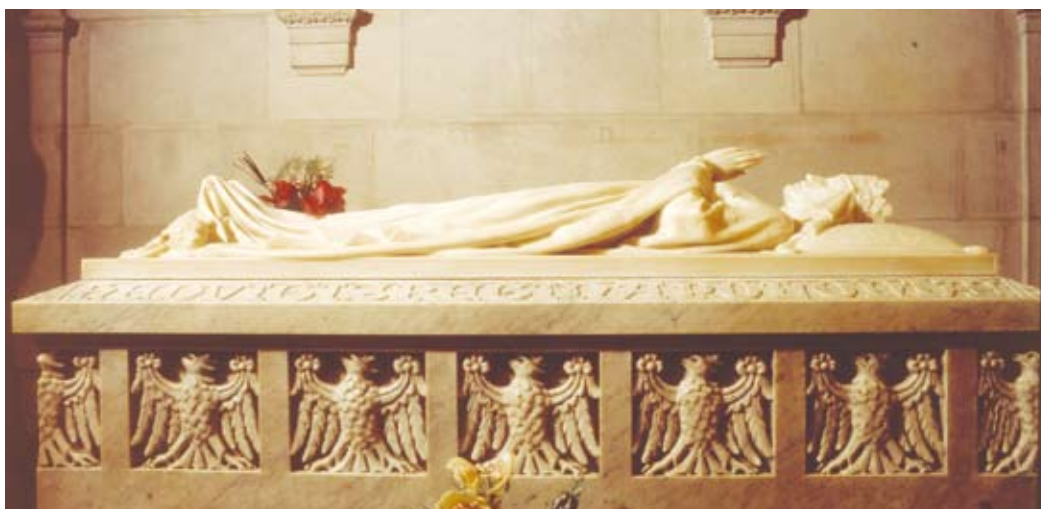
Tombeau d'Hedwige installé dans la cathédrale de Cracovie, au Wawel.

« Dès sa disparition, le tombeau de la reine attira de nombreux pèlerins appartenant à toutes les couches sociales. Le culte d'Hedwige, très fort au Moyen Age, s'est estompé pendant les siècles suivants et les démarches visant à sa canonisation n'ont été reprises qu'au XIX e siècle. Le tombeau de la reine a été ouvert en 1887. Les examens anthropologiques ont permis de constater qu'Hedwige était une grande femme blonde, svelte et robuste (175 à 182 cm). [...] Dans le tombeau sont conservées trois sortes de tissus de soie. [...] Les manches de la tunique de la reine étaient bordées de larges galons. [...] On a aussi retrouvé quelques menus vestiges d'une couronne en cuir doré. La reine tenait dans ses mains un globe royal en bois doré surmonté d'une croix [...].